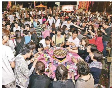
元朗大樹下天后誕盆菜