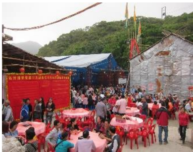
西貢良船灣天后誕盆菜

盆菜起源自宋代，由宋帝昺年間留傳，從落難香港的「黃帝菜」，搖身一變而成為新界原居民每逢祭祀、及節日喜慶為招待客人的菜餚，盆菜是香港圍村獨特的傳統菜式，初時以木盆盛載，食物材料一層疊一層的排放，現今盛載的盆菜的器皿，大都以銅盆及鋅盆代替木盆，方便加熱進食。每年元朗十八鄉的天后誕，村民都會在廟前設百幾席盆菜與村民同慶天后，讓村民嘉賓吃個飽，這正是他們的好客之道，亦成為他們的習俗之一，而且吃過盆菜更會帶來天后的祝福及保佑，豐衣足食